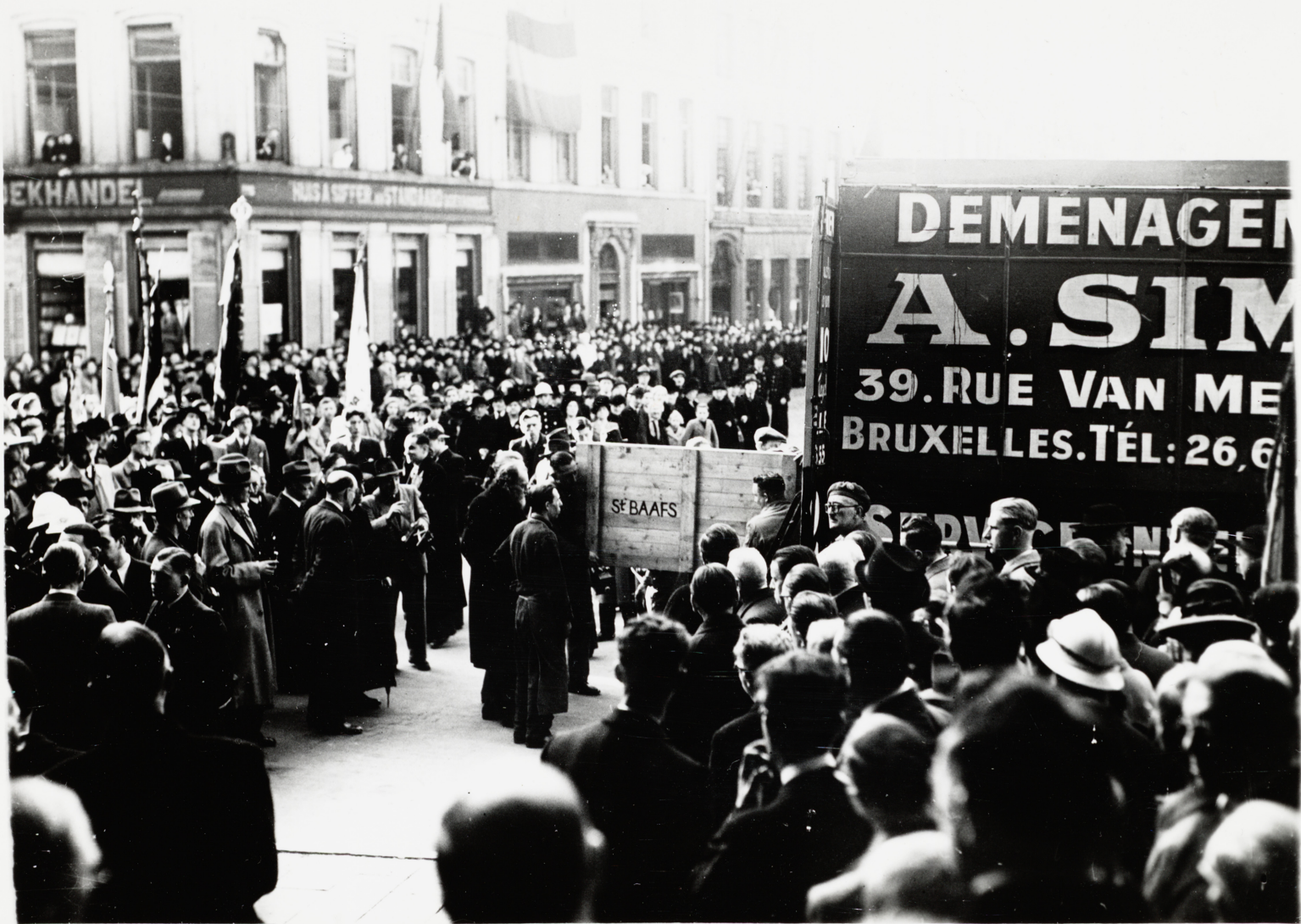
De feestelijke aankomst van het Lam Gods voor de Sint-Baafskathedraal na de Tweede wereldoorlog 30 oktober 1945.